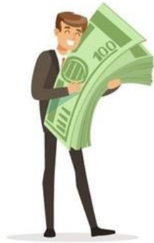
Папа получил зарплату