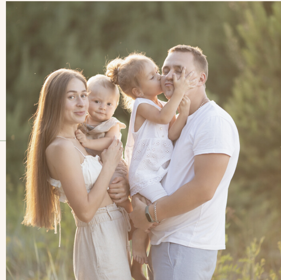
а это вся моя семья

Мы любим кушать сладости, поэтому стараемся готовить их дома сами. А когда ко мне приходит подружка в гости, мы с мамой на скорую руку готовим десерт к чаю, шоколадную колбасу